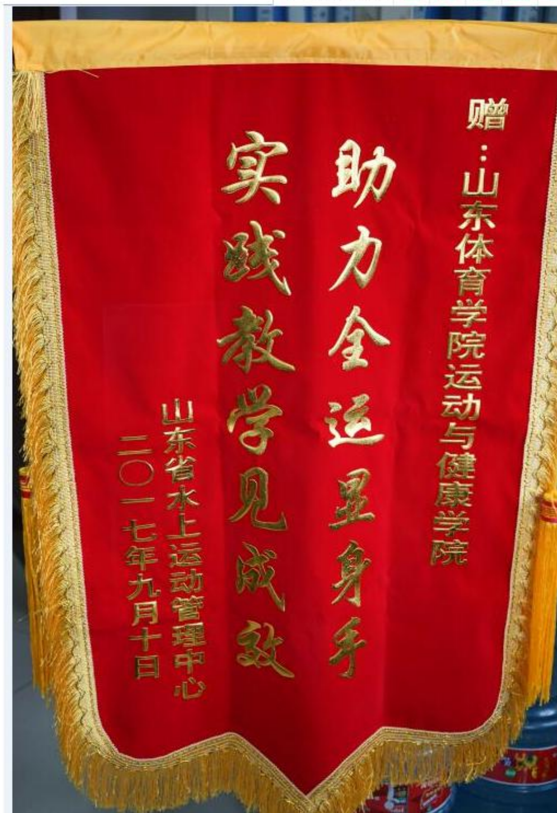
图11. 山东省水上运动管理中心发给山东体育学院运动与健康学院的锦旗。