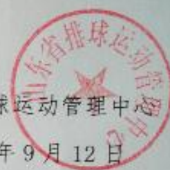
图3-4. 山东省排球运动管理中心发给山东体育学院的感谢信