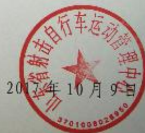
图9. 山东省射击自行车运动管理中心发给山东体育学院的感谢信。