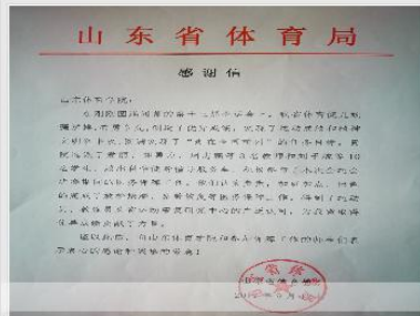
奋发有为 协同作战——11封感谢信1面锦旗来自山